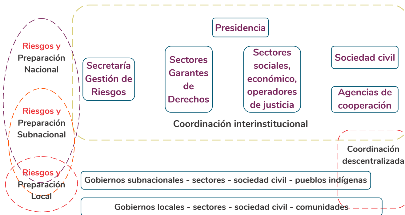
Figura 1. Niveles de preparación de respuesta

puede aplicar un monitoreo y vigilancia participativos con puesta en funcionamiento de sistemas de alerta temprana inclusivos.