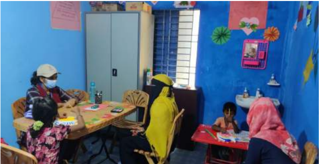
sesión de salud mental y apoyo psicosocial para una mujer y sus dos hijas en un campamento de refugiados rohingyas en Bangladesh, mayo de 2020.